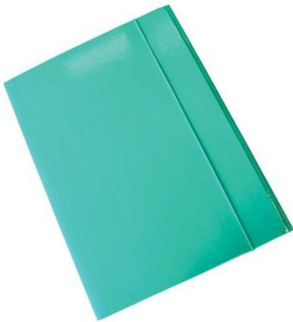
Cartellina di arte